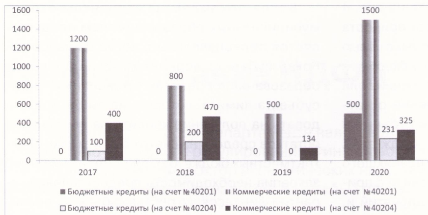
Рис. 4. Динамика привлечения коммерческих и бюджетных кредитов в разрезе единых счетов бюджета Республики Адыгея и бюджетов муниципальных образований Республики Адыгея в период с 2017 по 2020 г., млн руб.

средств на счетах местных бюджетов. До его применения на практике целевые межбюджетные трансферты перечислялись в местные бюджеты в начале финансового года и нередко в сумме годовой потребности, что оставляло их без движения и, как следствие, снижало ликвидность, а отвлечение средств из регионального бюджета на год вперед увеличивало риски кассовых разрывов.