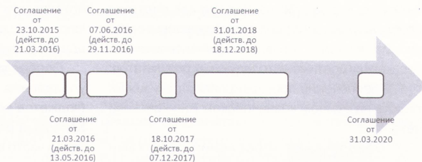
Рис. 2. Перечень и сроки действия соглашений, заключенных между УФК по Республике Адыгея и Министерством финансов Республики Адыгея по перечислению остатков средств государственных учреждений

ключено Соглашение о перечислении остатков средств бюджетных и автономных учреждений Республики Адыгея со счета № 40601, открытого УФК по Республике Адыгея в подразделении Центрального банка Российской Федерации, в республиканский бюджет Республики Адыгея, а также их возврате на указанный счет. Затем в марте 2016 г. было подписано новое Соглашение на